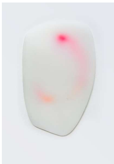
Silicone translucide - 2016

Immobile face à un objet, immergé dans une expérience ou accueilli par un visage, créer les conditions pour inviter chacun à sentir sa place dans un monde connecté, la pure joie d'exister ».