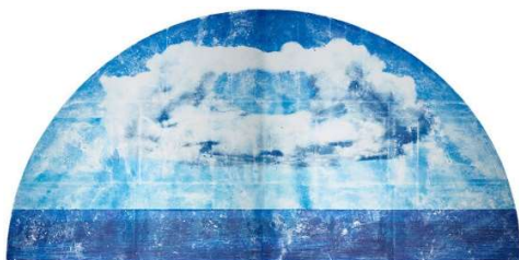
Transfert sur plâtre - 2014

Cette quête m'a naturellement conduit à m'intéresser à l'alimentation, comme acte par excellence de communion avec son environnement. L'agriculture révèle, grâce au ciel et au travail de l'homme, le meilleur de la terre. Dans un repas s'incarnent la créativité et l'amour de celui qui l'a préparé. La matière se transforme en l'énergie qui nous permet de prendre part au monde.